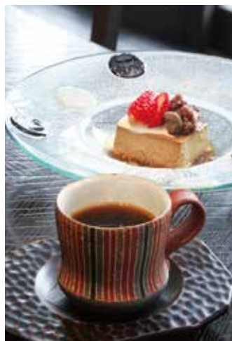
鉄窯で沸かした湯で淹れたコーヒーはまるやかな口当たり。