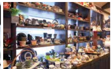
さまざまなテイストの器が並び、見るだけでも楽しい。