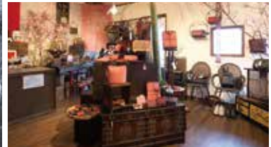
店内には工芸作品などを展示する「ギャラリー セン」も併設。