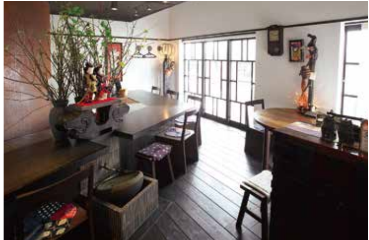
しっとり落ち着いた空気の流れる和カフェ「この葉」。挽きたての豆を使ったコーヒーと季節の甘味が評判だ。