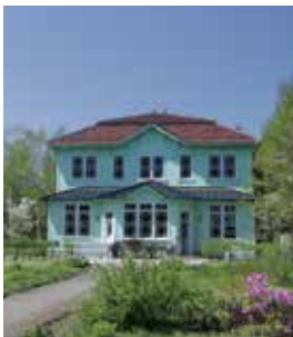
登録有形文化財の深沢紅子野の花美術館。