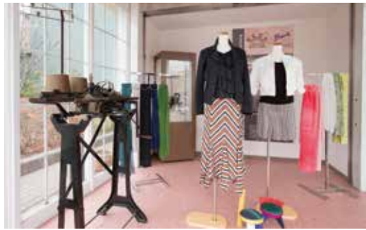
本社屋にある展示ルーム。100年前の機織り機からは歴史を感じる。

合の理事長をなされる立場になられて、ニット業界の重鎮として、現在の状況、今後の動向をどう考えておられますか？