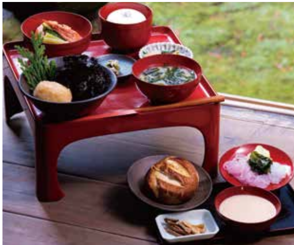
昼コースは2,000円～。余計な手を加えず、素材の味を生かした約10品を楽しめる。

用したシンプルながらも味わい深い料理の数々。そのどこか懐かしい味にリピーターとなる客も多い。また、珠洲焼の「伏見窯」と工房も併設。料理と共に伝統工芸を楽しめるのも魅力の一つだ。