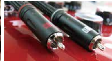
宗七音響オリジナルのインターコネクトケーブル「IC01-RCA」。