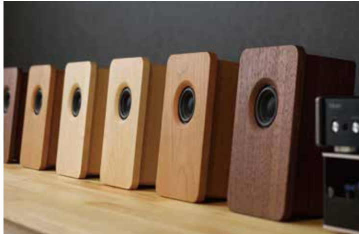
フォトフレームをモチーフにした天然木のバッシュスピーカー。デンマークの「スキャン・スピーク社」のユニットを使用。