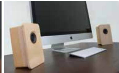
コンパクトながらも驚きの音響を実現。インテリアとしても映える。