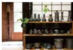
座敷には珠洲焼ギャラリーも併設している。

珠洲市三崎町伏見ワ部23 ☎ 0768・88・2657 営 / 11:30~14:00、19:00~22:00 ※昼夜ともに完全予約制 休 / 不定休 席 / 30席 P / 10台