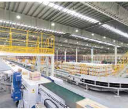
搬送経路に多数の分岐機能を備えた仕分け搬送機。