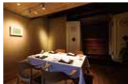
立派な土蔵の屏が印象的な特別個室。