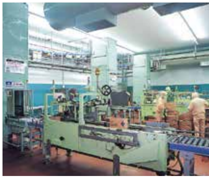
省力、省スペースを物流を効率化する垂直搬送機。