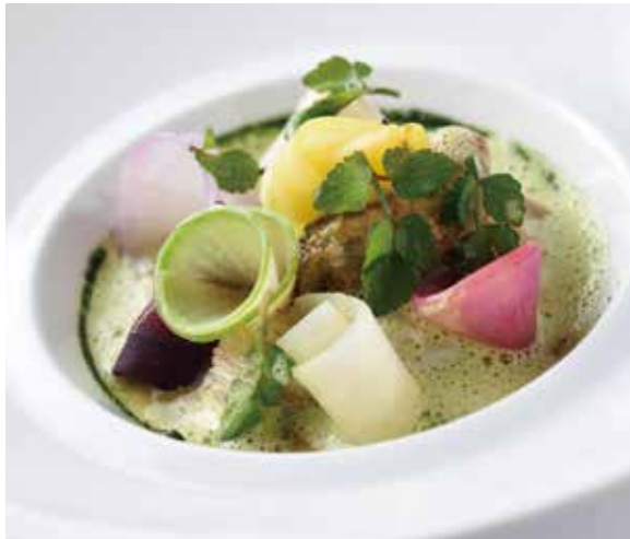
5,670円のディナーコースの一品。「根菜と牡蠣のムニエル、車鰯を海藻のソースで」。

能登の豊かな自然が育む食材を使った料理を地元作家の器で提供する品々は、良い意味でゲストの期待を裏切るものばかり。歴史を重ねた建物で古き良き日本の風情を感じながらフレンチを楽しめる。