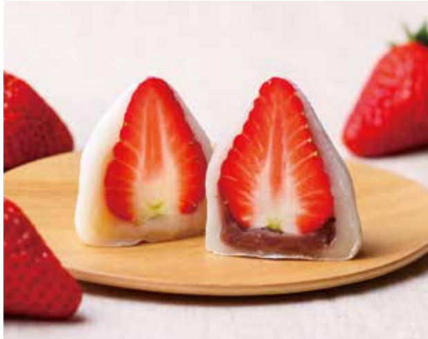
地元小松の「本田農園」の摘みたてイチゴを使用した「いちご大福」。白餡、黒餡各324円。

平成百名水「桜生水」を使って炊いた餡で作る豆大福は自然な優しい甘さの人気だ。また、地元農家との連携で作る、イチゴやぶどう、トマト、ブルーベリーなど季節ごとの瑞々しいフルーツや野菜を包んだ「産地大福」も好評。