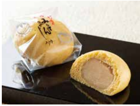
創業から試行錯誤して作り上げた「みそまんじゅう」。

餡の材料になる手亡(白いんげん豆)は全て国産にこだわって北海道の農家さんと直接契約して仕入れていきます。それから、商品の膨らみ加減だけで一千万単位の製造機械を変えたり。お客さんが分かるかな?というぐらいの差なんですけど、自分が食べ比べてみてこちらの方が良いと思ったので、やっぱりベストを尽くさないと。それで、お客さんが少なくなったり売