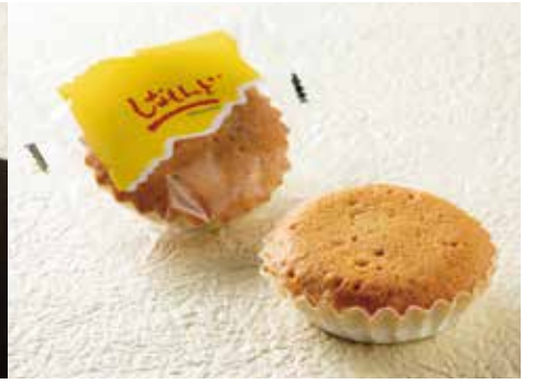
全国菓子博覧会名誉総裁賞を受賞した「しなもんど」。