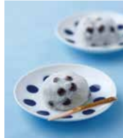
売切必至の看板商品「豆大福」。162円。