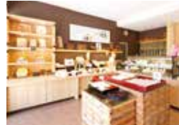
2017年に改装、新たに生まれ変わった。