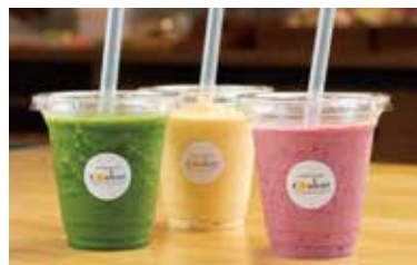
氷を入れず、フルーツの旨みを濃縮したスムージーは約10種類。