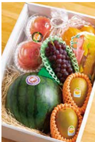
フルーツの盛り合わせは予算や要望に応じてセレクトしてくれる。1階の販売、カフェスペース。2階にもカフェスペースを用意。