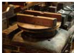
昔ながらの釜で炊く御飯は逸品。