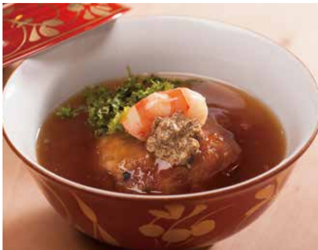
無農薬栽培の加賀れんこんを使った同店の名物料理「れんこんまんじゅう」(860円)。

品書きにびっしりと書き綴られた日替わりの一品料理が中心。中でも、昔ながらの釜で炊く御飯を使った丼の一品「塩うにわかめおぎにり」が人気。シンプルながらも一工夫加えた品々は繊細な味付けが魅力だ。