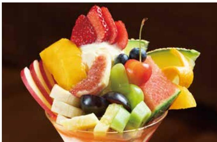
白桃やマンゴー、イチゴ、メロンなど季節のフルーツをふんだんに使ったパフェは8〜9種類揃い、1,000円から楽しめる。