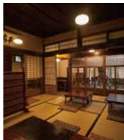
情緒を感じさせる中庭を囲む座敷席。