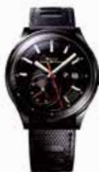
POWER RESERVE. PM3010C-P1CFJ-BK