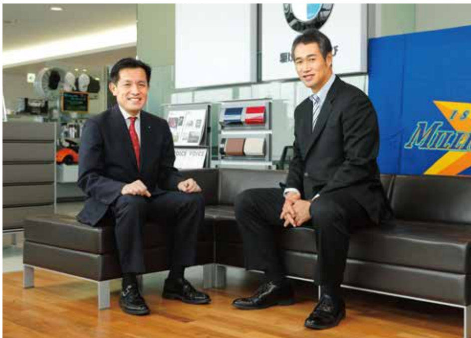
木田 優夫(きだ・まさお)

日本大学明誠高等学校からドラフト1位で読売ジャイアンツに入団し、150キロを超える剛速球を武器に、先発、中継ぎ、抑えて活躍。その後、メジャーリーグでもプレーするなど、日米7球団を渡り歩き、独立リーグで今なお現役を続行している。