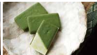
サクサクの食感が魅力の「抹茶ラングドシャチョコレート」。