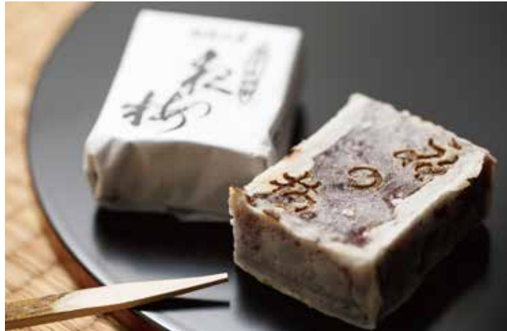
北海道産の小豆を使って、毎日丁寧に手作りする「島倉屋特製 夜の梅」。御進物やお茶の友として県内外で人気。