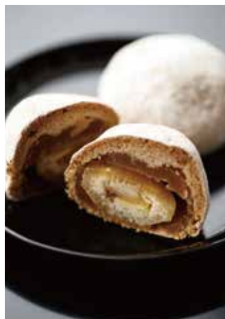
国産の栗を1個まるごと贅沢に使用した「ほっ栗」。