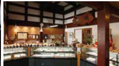
創業100年以上の歴史を感じさせる落ちつきのある店内。