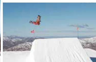
ニュージーランドを中心に世界各国の大会を転戦している。