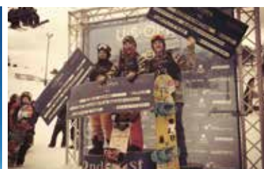
「バートンUSオープン」では予選大会で優勝し、本選に出場した。