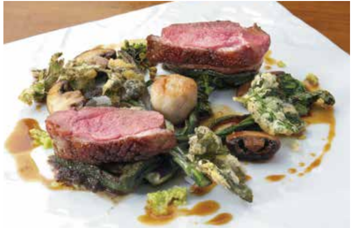
「シャラン産鴨ロースのロティ わさびと春野菜添え」。能登の分葱とせんなのフリットなど付け合せも一手間かける。