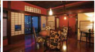
町家の雰囲気にも調度品や食器がしっかりと馴染む。