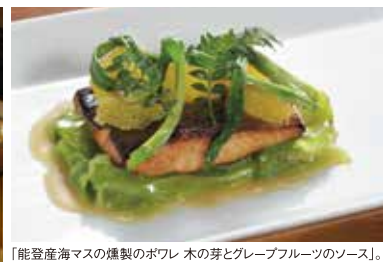
「能登産海マスの燻製のボフレ 木の芽とグレープフルーツのソース」。