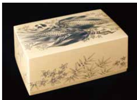
自然との共生をテーマに制作した「秋日」。

その可愛らしいフォルムに一目惚れしました。それからこのデザインが頭から離れなくなつてしまつて。街でMINIが走っているのを見かけると振り返つてしまうほどでしたよ。