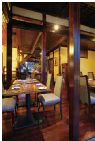
町家を出来るだけ活かしたという味わいのある店内。