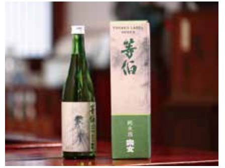
昨年3月に発売された「純米酒 善伯」、720ml 1,600円(税別)。