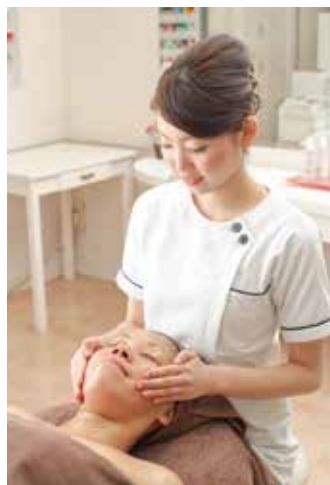
「低料金・高技術」をコンセプトにしたメニューが揃う。