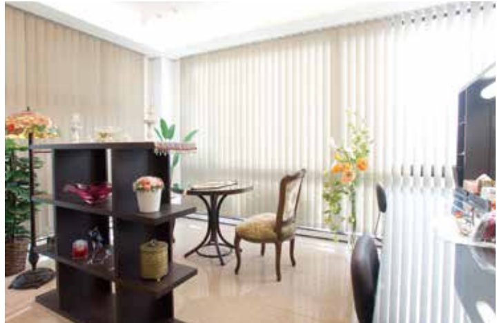
根塚店の2軒隣にある会員限定の別館「Rose」。高級感漂う店内でゆったりと過ごすことができる。