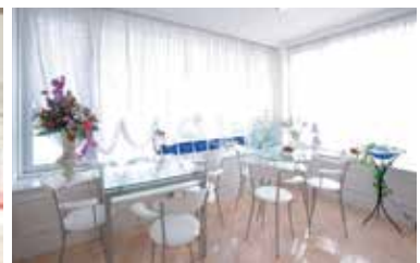
明るく清潔感あふれる「エミースタジオ根塚店」。