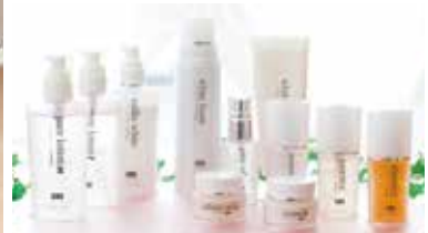
厳選された天然成分で作られたジュビラン ル・ショワシリーズ。