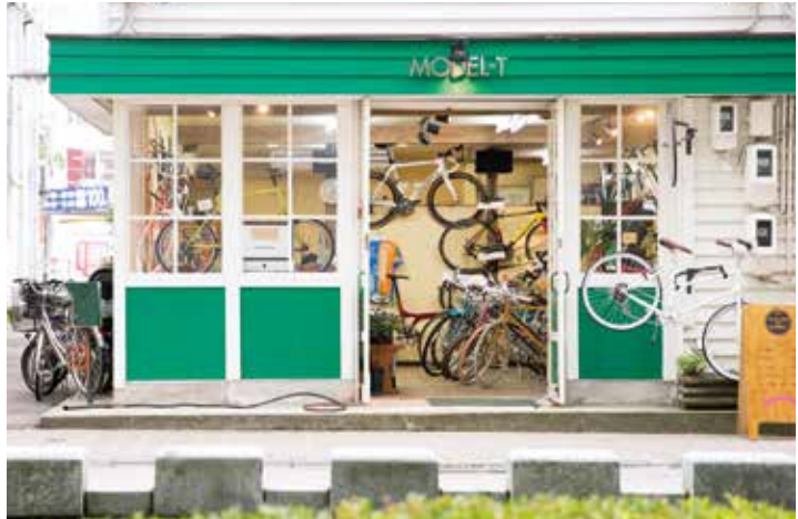
〔KORINBO109〕裏、せせらぎ通り入口にある同店。白と緑を基調としたオシャレな外観が目をひく。