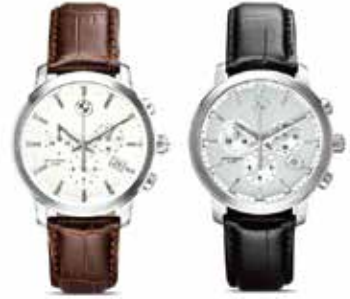
ブラウン・レザー

ストラップはブラック・レザー(牛革)文字盤にシルバーのBMWロゴ世界最大の時計専門店TOURNEAUと開発、製作／BMWギフト・ボックス入り／ケース直径:約40mm／駆動方式:スイスRONDA社製ムーブメント／素材:ステンレス・スチール・ケース／防水機能10気圧／30,700円(税抜)