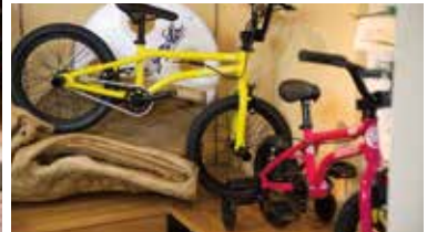
トップブランド「ARESBIKE」が手がけるキッズ用BMX。