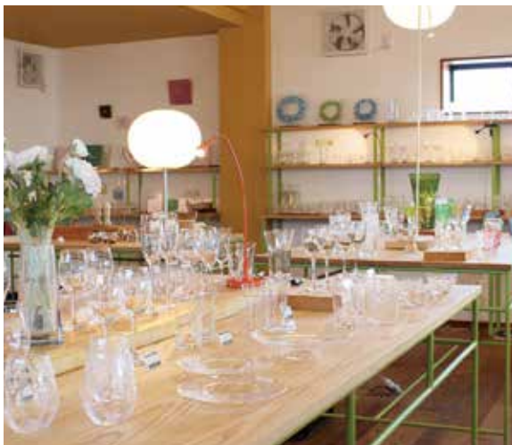
工房が併設されており、職人の技を間近で見ることができる「黒壁ガラススタジオ」。

の展示エリアとして知られている。また、地元素材を使ったフレンチレストランや滋賀県産の良品を揃えた郷土物産店など、レトロモダンな街並みの中で様々な楽しみ方ができると評判だ。