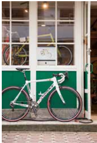
自転車王国・ベルギーのトップブランド「RIDLEY」。