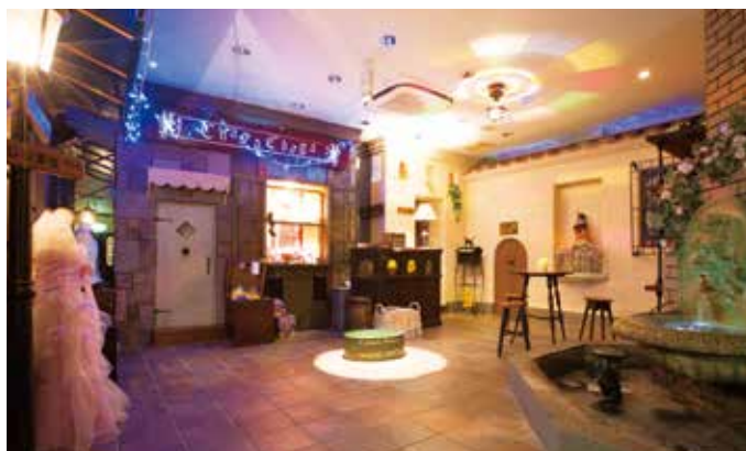
まるでテーマパークのような受付や待合室。とても歯科医院とは思えない。