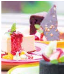
各種スイーツが人気の「96CAFE」。