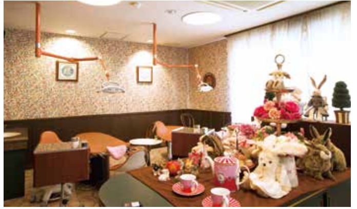
診察ユニットも特注。あくまで「あすなろ王国」の世界観を徹底している。