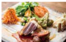
レストラン「ROKU」のランチプレート。