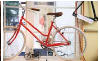
若者に人気のカジュアル街乗り自転車「TOKYOBIKE」。