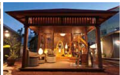
バリ島の建築「バリ」をイメージした「BaliSense」。