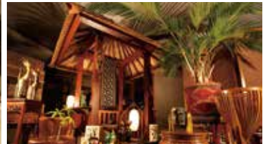
現地から直輸入するアジアテイストの家具や雑貨を販売。