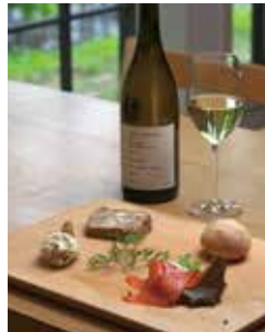
園内の地下室で熟成されたワインは絶品。