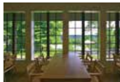
素朴ながらも洗練感のあるレストラン。