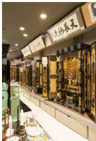
金箔を使用し、蒔絵や彫刻の技術が活かされた金沢仏壇。