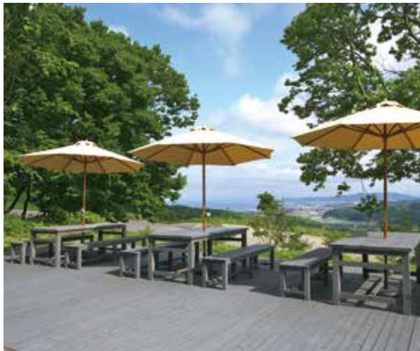
眺望抜群のテラス席ではドリンクやスイーツ、パンなどのカフェメニューを楽しむ。

供。併設するショップでは4種類のワインのほか、手作りのコンフィチュール、農園で飼育した新鮮な鶏卵、海洋保存食などを販売する。ギャラリーでは器を中心に様々な企画展を開催している。