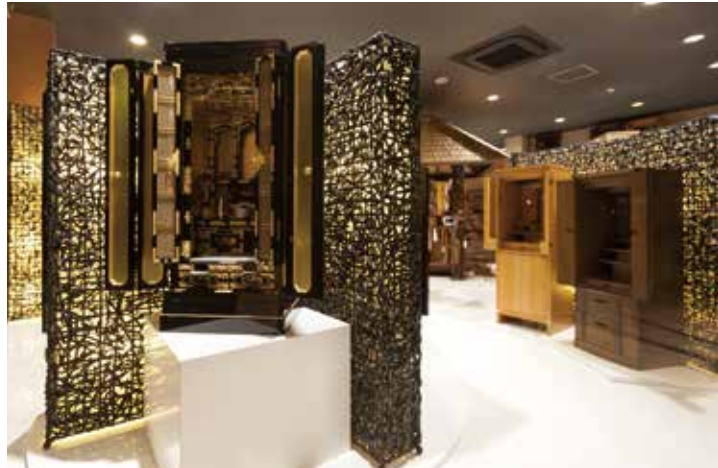
大型の最高級仏壇からミニ金仏壇、手入れが簡単で各宗派に対応する唐木仏壇、家具調仏壇など品揃えは豊富。