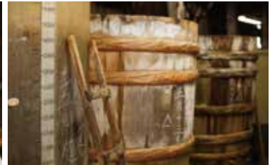
大正7年から醤油作りを始め、輪島のふるさとの味を守り続けている。