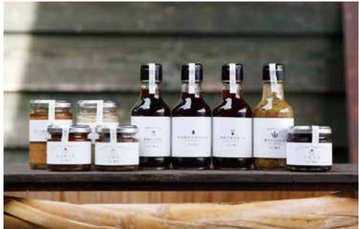
昔ながらの製造方法で丁寧に作った丸大豆醤油や丸大豆醬油に地元産の原木しいたけを漬け込んだゆずポン酢など人気商品は多数。