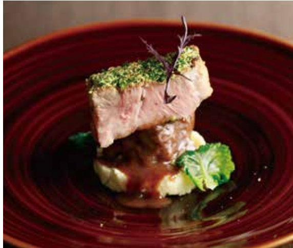
鮮やかなベルシャードソースが能登豚の旨みを際立たせる「能登豚三角肉のプレゼ」。

いる。オープンキッチンの正面には山中漆器の材料となるくるみの巨木をディスプレイ。山中の木地師や作家が手掛けた器や酒器、シュガーポットなどが置かれ、職人の手仕事を楽しむこともできる。