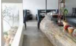
地元作家のクラフトがインテリアされた店内。

湯の街ビストロ 江沼スタシオン 加賀市山中温泉湯の本町ク38 ☎ 0761-78-1911 営/11:30~14:00 (L.O.) 18:00~20:30 (L.O.) 休/日曜 席/20席 ※全席禁煙 P/10台 価格/ランチ2,000円~ ディナー5,000円~ (前日までの要予約)