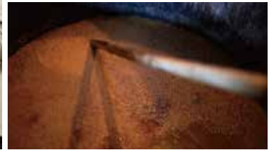
醤油や味噌には出来る限り地元の素材を使用する。