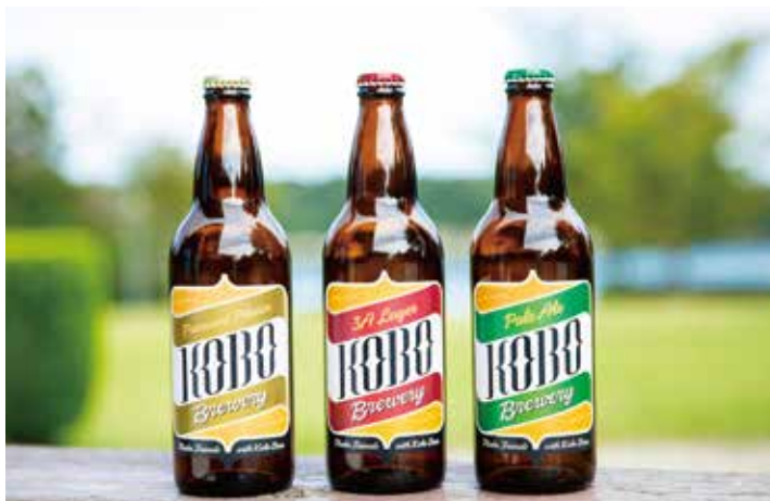
クラフトビールは「プレミアントピルスナー」、「3Aラガー」、「パールエール」の3種類。各2本ずつの6本セットで4,860円(送料、税込)。