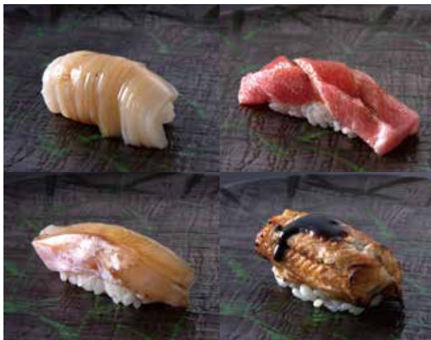
(左上)天然ホタテ。(右上)塩釜のマグロ。(左下)マハタ。(右下)穴子。予算はお任せで。

そのまま表したような存在感を放つ。魚津産コシヒカリの古米に3種類の赤酢を合わせたシャリは口の中ではらりと解け、優しく繊細な味わい。熟成の頃合いを見極めて提供するネタとのバランスは見事だ。