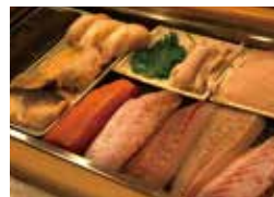
魚津のほか、北海道や築地の魚介が並ぶ。