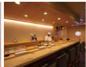
心地よい緊張感がありながら寛げる空間。