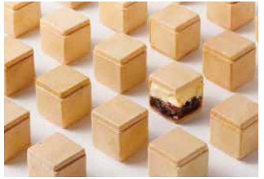
新商品「窓」はつぶ餡とバターが入ったキューブ状の最中。