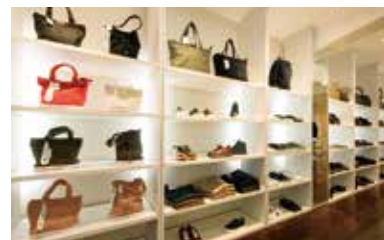
ファッションディレクター・干場義雅氏とのコラボモデルも多数。