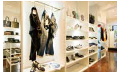
フォーマルからカジュアルまで様々なテイストのアイテムが揃う。