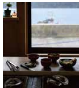
穴水湾を眺めながらの食事は格別。