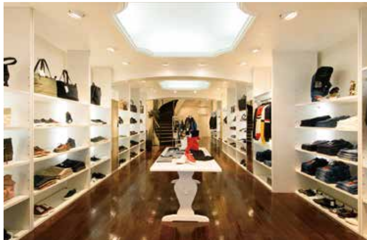
国内外の最新ファッションアイテムが並ぶラグジュアリーな雰囲気の店内。2階にはドレスアップラインを揃える。