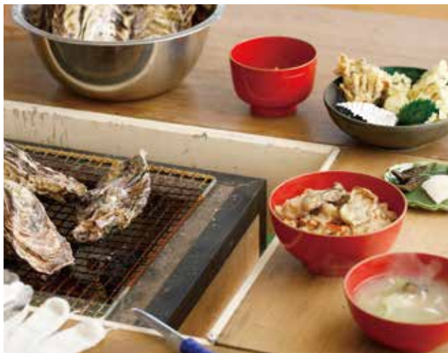
同店の定番メニュー「オリジナルかきフルコース」(3,300円)。味噌汁、漬物、デザート付き。

いる。オリジナルブレンドのスパイスを効かせた「牡蠣のアーヒージョ」も人気。牡蠣と一緒にとれるなまこの酢のものも能登ならではの。眼前の穴水湾を眺めながらの食事は、美味しさで楽しさを倍増させてくれる。