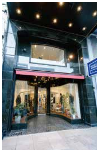
昨年、移転リニューアルでスケールアップを果たした。